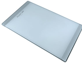
Tagliere in cristallo 8631 300