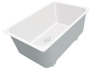
Vaschetta bianca 8153 100