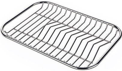
Griglia portapiatti inox 8100 154