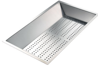
Vaschetta forata inox

* solo in abbinamento con l'accessorio 8644 101