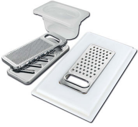
Kit grattugia con supporto per anello e vassoio di raccolta alimenti