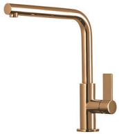
Miscelatore Omega Copper